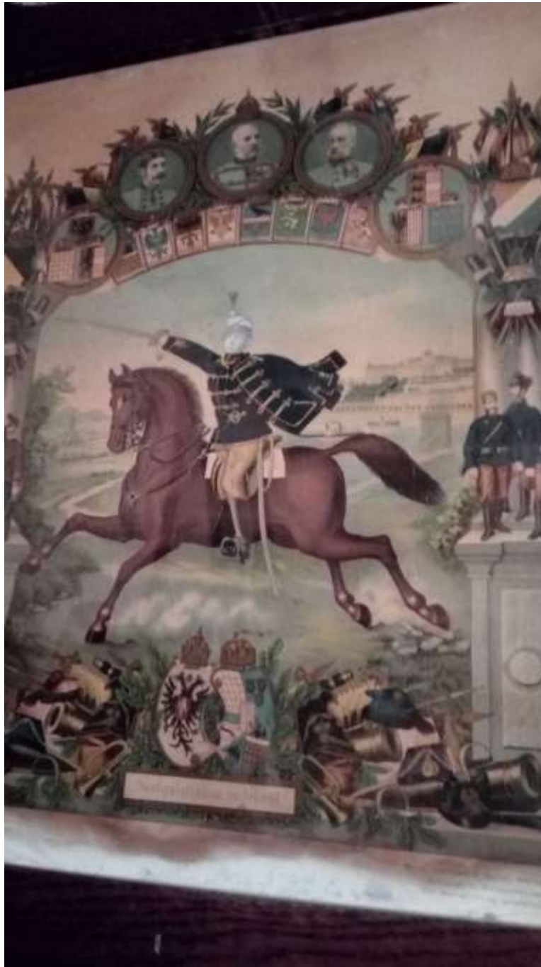
12.kép Böröcz Károly obsit levele, melyet szolgálati ideje letöltésének emlékére kapott.