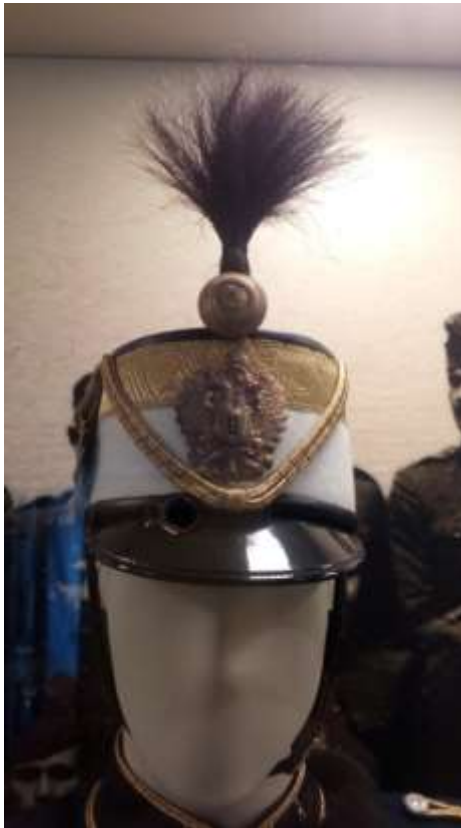
21.kép A 9. Nádasdy huszárezred fehér színű csákója.