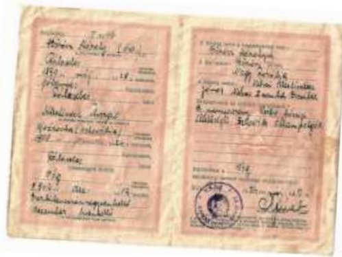
3.kép Böröcz Károlynak és 2. feleségének házassági anyakönyvi kivonata.