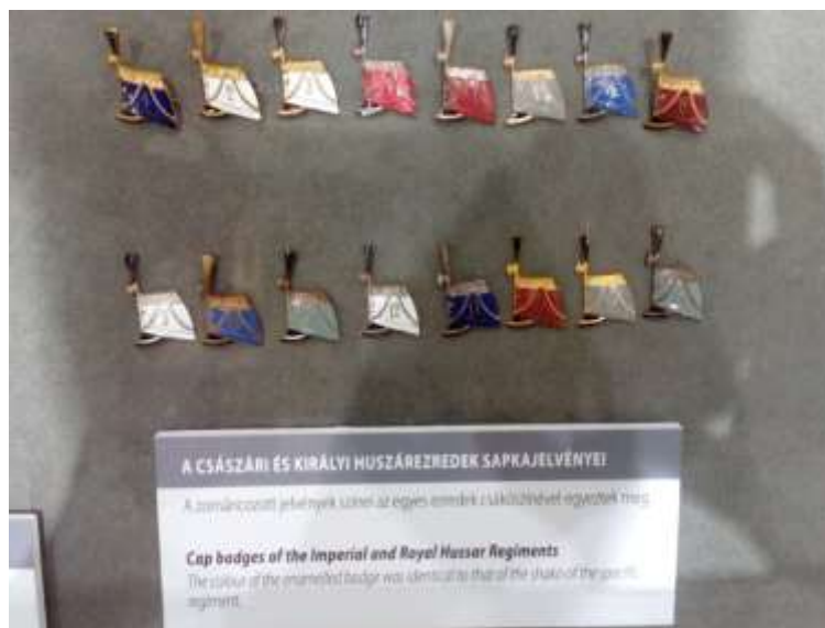
20.kép A 16 huszárezred különböző (egy-egy egység azonos) színű csákói.