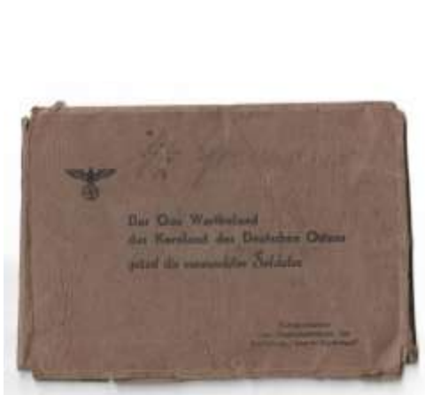
13. kép A levélborító az SS felirattal.

1944-ben hivatalosan be kellett vonulnia. Ezt a Szálasi-rendszer által bevezetett új törvény tette lehetővé, miszerint minden férfi 17-60 éves korig köteles bevonulni. Ugyan könnyen előfordulhat, hogy ennek a kötelezettségének nem tett eleget, ugyanis akkor már igencsak reménytelen volt a helyzet, és sokaknak nem érkezett meg a behívójuk. Nem is beszélve arról, hogy maga a rendszer sem vette igazán komolyan ezt az intézkedését. Gondolkodóba estem. Találtam egy csoportképet is, ahol bajtársaival szerepel, tehát mégis bevonulhatott és könnyen előfordulhatott, hogy fogságba esett vagy inkább megsérült, melyet az iratok között talált levélborító feliratozásából gondolok. (13-14. képek)