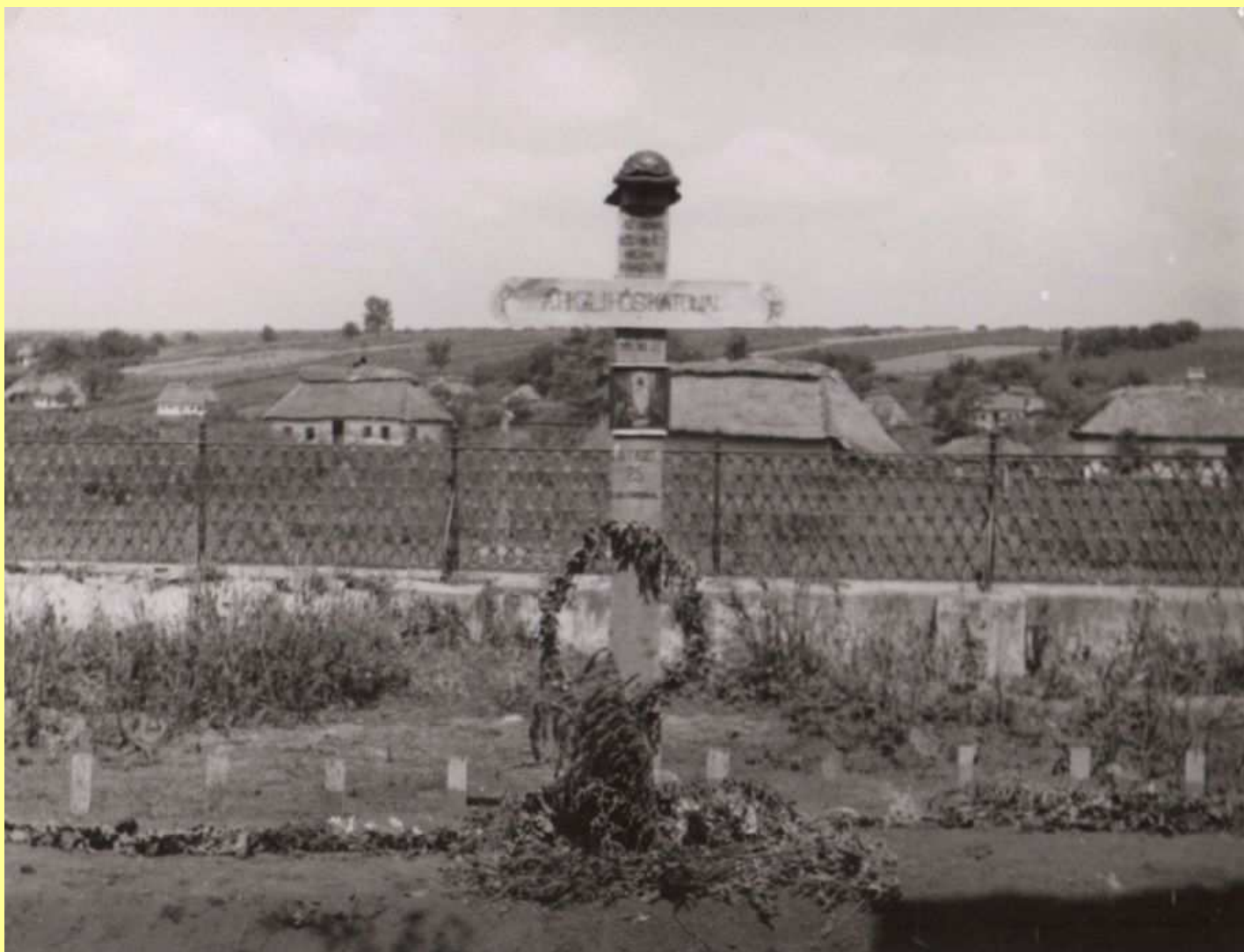
A gordijevkai magyar páncélos hősi temető.