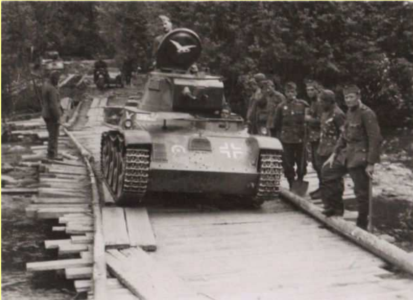
Szükségvár a Kárpátokban.