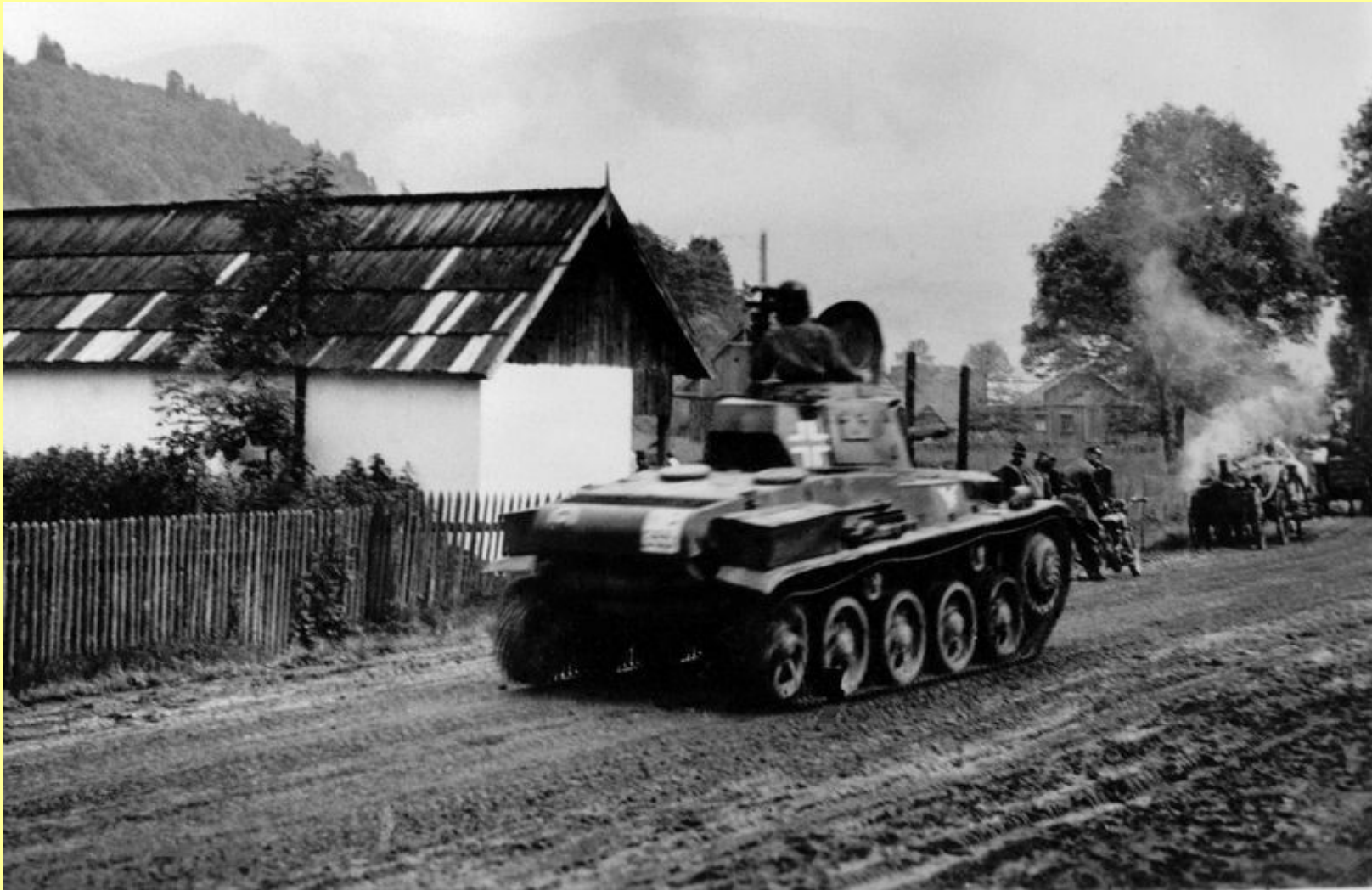
A Kárpátokban 1941 nyarán.