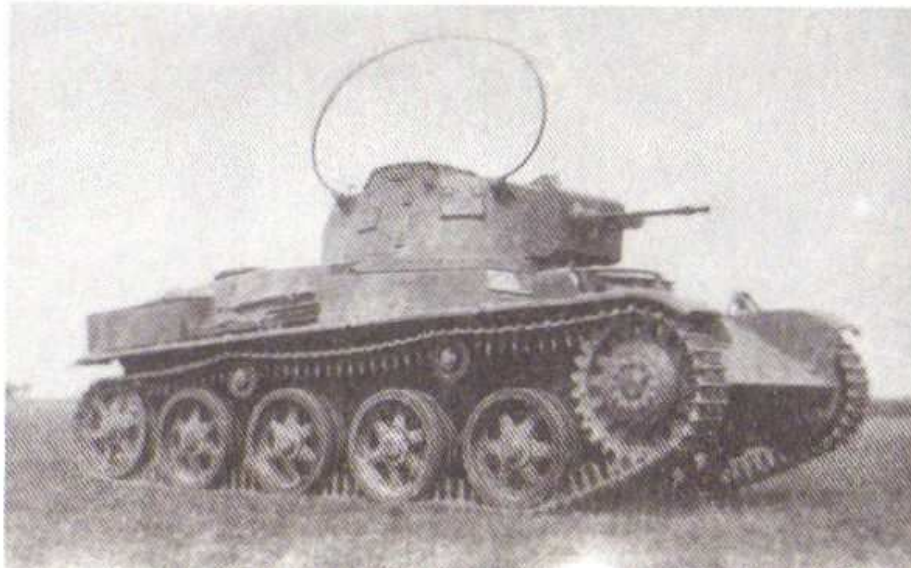
38 M Toldi könnyű harckocsi

Lépcsőmászó képesség: 0,60 m Gázlóképesség: 0,70 m Árokáthidaló képesség: 1,75 m Hatótávolság/úton: 200 km Üzemanyag-kiszabat: 253 l Sebességek száma: 5 előre, 1 hátra Páncélzat: 5 – 13 mm Fegyverzet/lőszer- javadalmazás: 1 db 36 M 20 mm űrmé- retű nehézpuska/208 db; 1 db 34/37A M 8 mm űr- méretű géppuska/ 2400 db Rádió: R – 5 (Toldi I) R – 5/a (Toldi II)