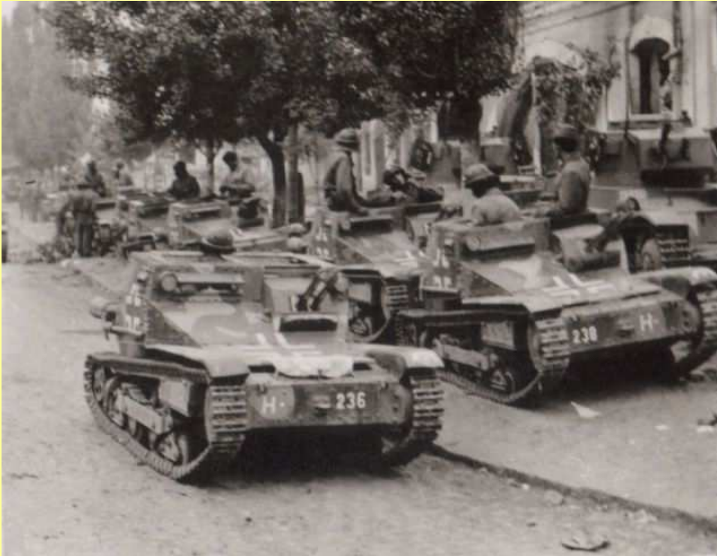
Ansaldo kis harckocsik Tulcsinban 1941. július végén.