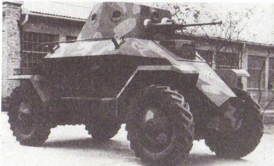
39 M Csaba felderítő páncélgépkocsi

Lépcsőmászó képesség: 0,5 m Gázlóképesség: 1,0 m Hatótávolság/úton: 150 km Üzemanyag-kiszabat: 135 l Sebességek száma: 5 előre, 5 hátra Páncélzat: 9 – 13 mm Fegyverzet/lőszer- javadalmazás: 1 db 36 M 20 mm űrmé- retű nehézpuska/200 db; 1 db 34/37A M 8 mm űr- méretű géppuska/ 3000 db; 1 db 31 M 8 mm űrmé- tű golyószóró Rádió: R – 4